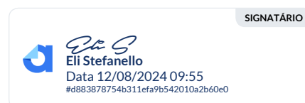
COMISSÃO DE JUSTIÇA E REDAÇÃO Presidente