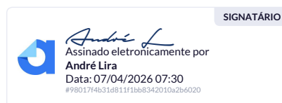
COMISSÃO DE JUSTIÇA E REDAÇÃO Presidente