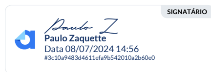
PAULO ZAQUETTE Membro CJR